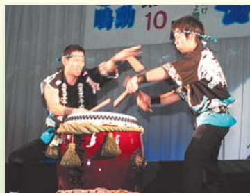
志賀豊年力太鼓保存会