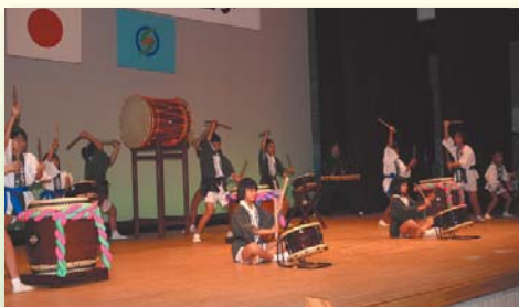
上熊野太鼓クラブ

この度、コミュニティ助成金を受けて下記の3団体に太鼓が整備されました。この助成金は、宝くじの受託事業収入を財源として、コミュニティの健全な発展と宝くじの普及効果が発揮できる事業を対象に交付されるものです。各団体では会員の日常練習はもとより、郷土芸能の保存継承、地域のコミュニティ活動の推進に役立たいと考えています。