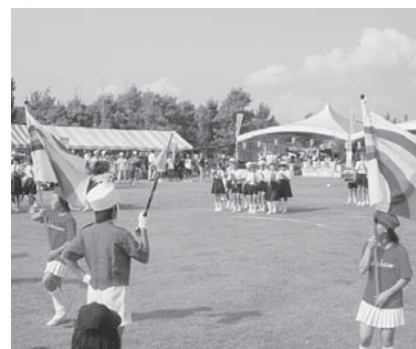
高浜小学校による鼓笛隊パレード