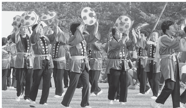
富来健康クラブによる輪踊り