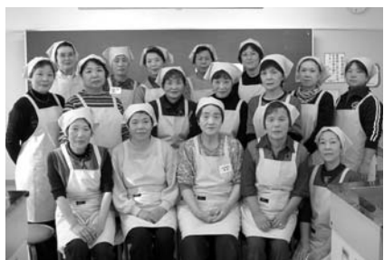
会員の皆さんのトレードマークは「ピンクのエプロン」です

『私達の健康は私達の手で』を合い言葉に、地域で活動を行っている『食生活改善推進員』を養成する講座を下記のとおり開催いたします。