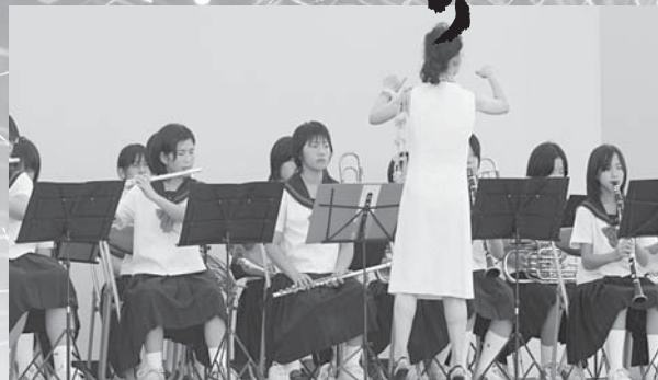
志賀中ブラスバンド部