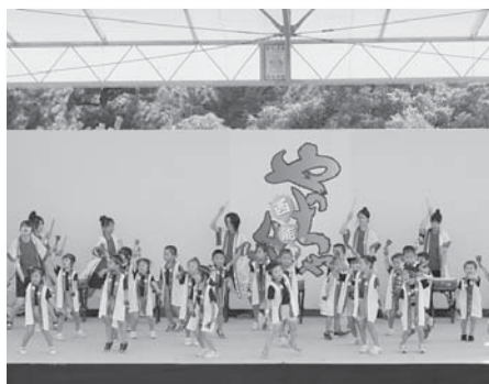
すばる幼稚園によるよさこい