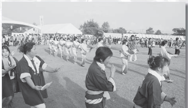
志賀町女性団体協議会による輪踊り