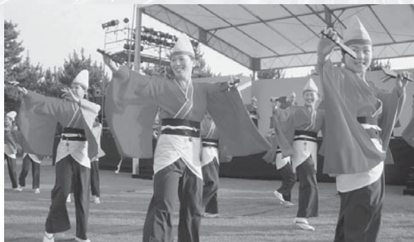
きらら華小町によるよさこい