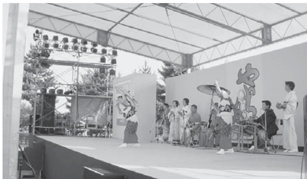
富来民謡保存会・勝栄会による民謡・民舞