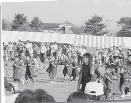
町立保育園によるよさこい