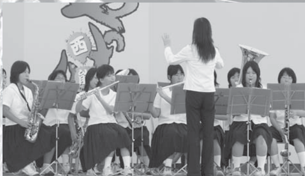
富来中ブラスバンド部