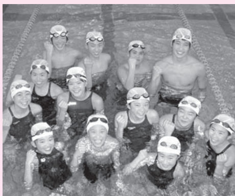
育生コースメンバー

今年はジュニアオリンピックに出場することを目標にし、そして将来は志賀町からオリンピック選手を輩出できるように頑張っています。