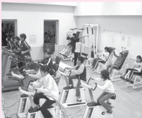
厳しいトレーニング

合宿では、1日に3回の練習(朝・昼・夜)で15,000から25,000,000mの泳ぎこみ続けました。他のクラブに通う生徒たちと練習や