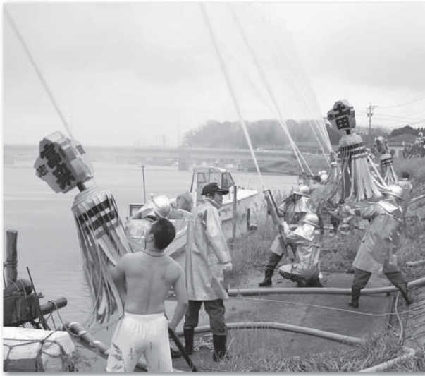
神代川での一斉放水の様子

1月10日(土)に志賀町消防団、全16分団303人が志賀町文化ホール前に結集し、消防出初式が行われました。