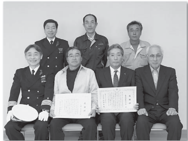
感謝状を持つ久木さん(左)と北社長(右)