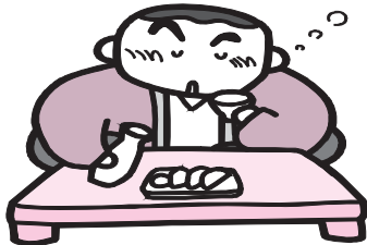
高尿酸血症 高脂血症