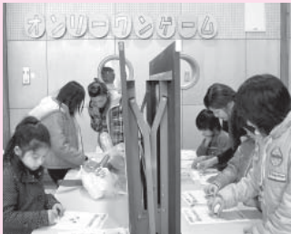
オンリーワンっておもしろいね