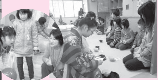
お抹茶とお菓子ちようだいしまあ