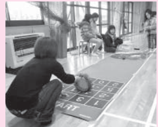
10点コースをさだめてナイスショット