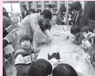
しゃぼん玉ステッキきれいにまわるかな