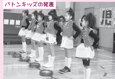
バトンキッズの発表