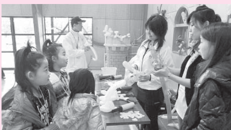
バルーンアートで剣や子犬ができたよ