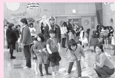
かっこいいフォームでドライブ