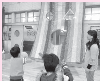
まるごと三角をねらってぞれ!