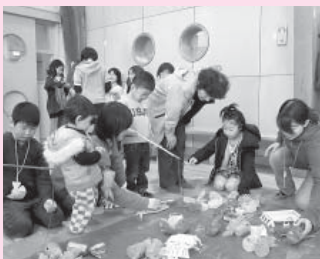
おいしいお魚釣れるかな?