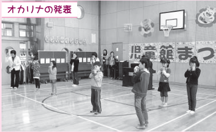
優しいオカリナの音色みれに届いたかな