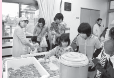
おいしいおはぎをピクピクで食べよう