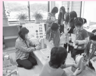
一等だつたらいいね・・・ワケワ