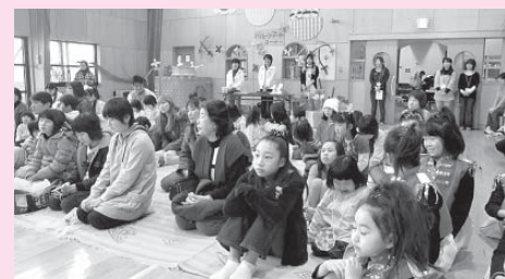
わが子の発表を見守る客席