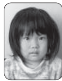
酒見 道筋香菜ちゃん