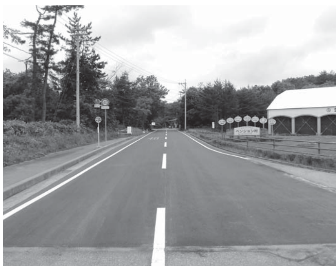
町道高浜志賀の郷線舗装工事