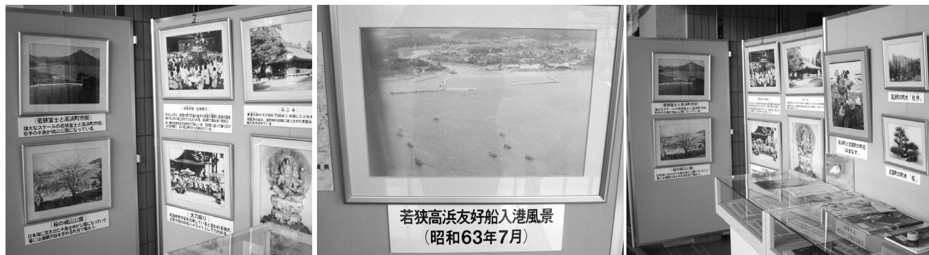
※志賀町役場本庁ロビーに姉妹都市交流の展示があります。

福井県高浜町と志賀町とは毎年姉妹都市交流を行っています。今年度は、姉妹都市提携調印式典を行って20年の節目の年。この交流事業を両町皆さんに親しみのもてる事業にしていきたいと考え、友好のシンボルである「友好旗」を両町の中学生にデザインしてもらい、作成しました。