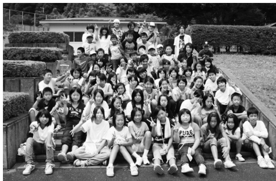
平成20年交流事業の様子

毎年交替で、交流事業を企画し、お互いの町に招待しています。平成21年は、志賀町高浜小学校の児童が、福井県高浜町リーダーズクラブの2泊3日の夏合宿に参加し交流を深めました。平成20年は、福井県高浜町の少年野球クラブを招待し、志賀町地元の少年野球クラブと交流試合を行いました。その他、高浜町の7年ごとに開催される「式年大祭」にご招待していただいたり、志賀疾風太鼓保存会の皆さんが高浜町の文化祭に参加したり、両町の水墨画会による合同展覧会の開催や各種スポーツ、文化交流など、多彩な交流を重ねてきました。