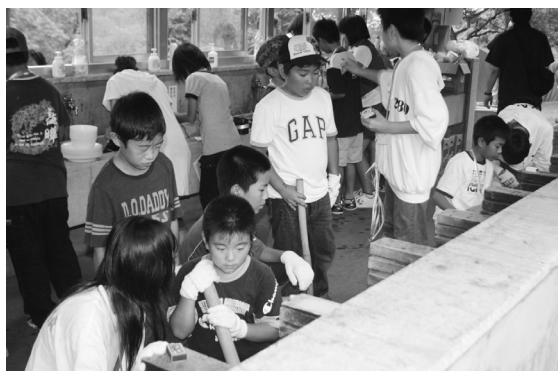
※2泊3日、高浜町リーダーズクラブのみなさんにお世話になりながら、仲間と協力してどんなことにもチャレンジし、大きく成長した高浜小学校のみなさん。