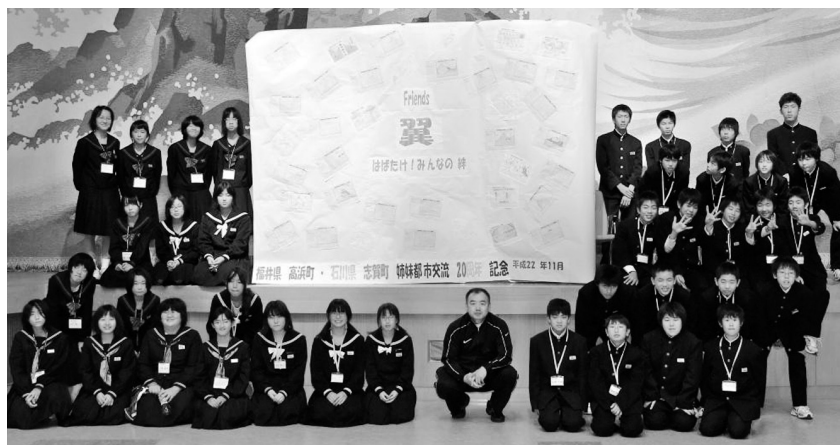
完成した友好旗と一緒に記念撮影。「Friends 翼 はばたけ！みんなの絆」も輝いています。