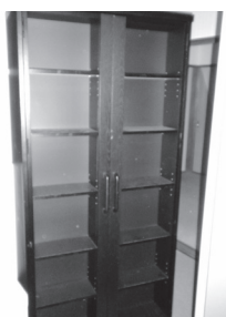
物品 53 木製本棚