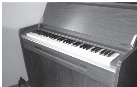
物品 38 オルガン