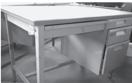
物品 30～37 スチール製テーブル