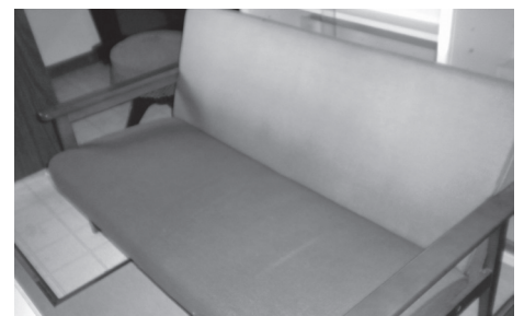
物品 40 椅子①