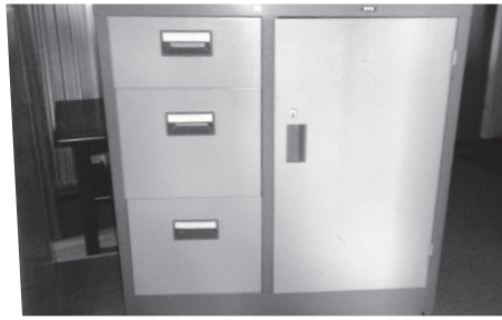
物品 21 スチール製キャビネット小④