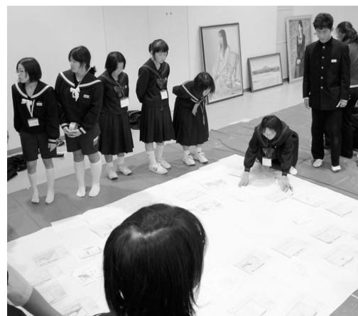
みんなでデザイン画の位置を確認しました。