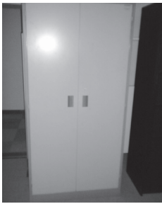
物品 15 スチール製キャビネット大⑥