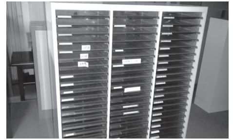
物品 27 スチール製トレイ付キャビネット小②