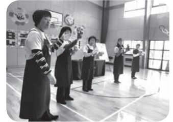
英語で歌遊びを披露(くまっこ隊)