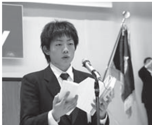
奥下君の惜別の辞に多くの人が涙した

ん」と富来高校との別れを惜しみ、「私たちの富来高スピリットは志賀高校という新たな命に引き継がれていきます」と話しました。