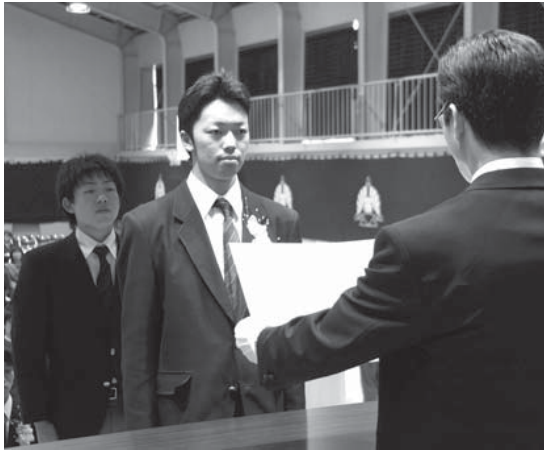
生徒一人ひとりに卒業証書が手渡された

最後に2人で、「富来高校というまるで陽だまりのような温かい場所で、3年間を過ごすことができました」と先生や両親に感謝の言葉を伝える会場の涙をさそいました。