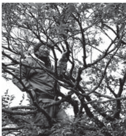
7台のトラックと10人の庭師が参加して前庭とロータリーの木を剪定している様子