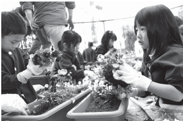
色とりどりの花を植える園児たち