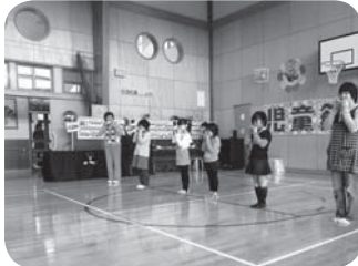
メドレーでふいたよ