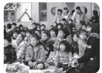
みんなで楽しんだ児童館まつり