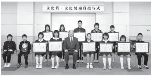
【受賞されたみなさん】

3月3日(木)文化ホールで、文化賞・文化奨励賞の授与式が行われ、版画や書など芸術文化の各分野で今年度、優れた成績を収めた児童、生徒が表彰を受けました。 文化賞には全国のコンクールなどで3位以内の成績を収めた4人が、文化奨励賞には全国で優秀な成績を収めたり、県内のコンクールなどで最高賞を受賞した8人が選考され、表彰状と楯が授与されました。