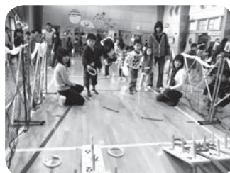
なかなか入らないぞ!