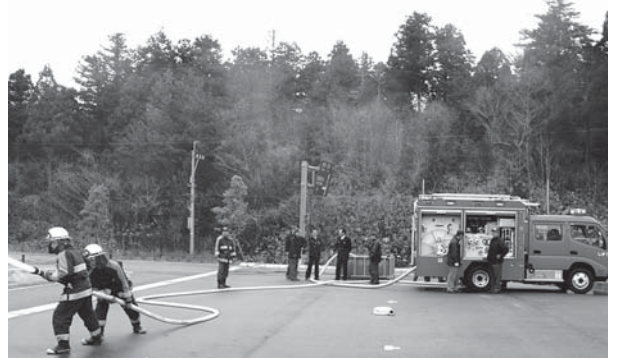
新型車両で水出しをする消防署員

式ではポンプ車をおはらいし、その後、水出しが行われました。署員たちは日頃の防災活動や消防活動に励んでいきたいと話しました。