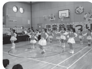
いろんな技ができるようになったよ