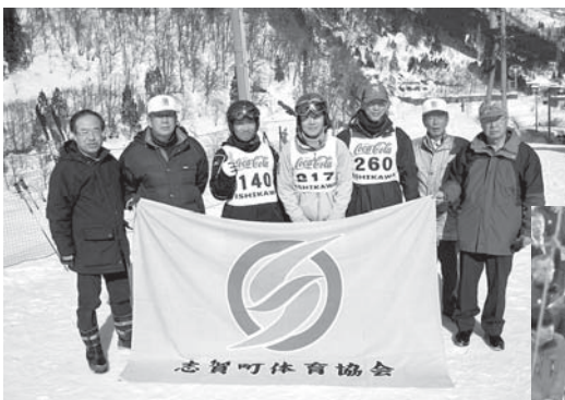
【出場選手のみなさん】