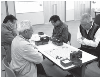
【熱戦が繰り広げられた囲碁会場】