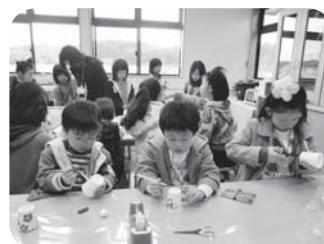
吹いてシュート作りに挑戦