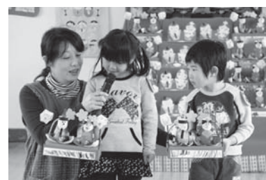
（上）ももの花運びレースの様子。 （下）自分の作ったひな人形について苦労したところを説明する園児たち。