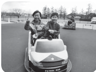
パトカーにのったぞ、イエイ