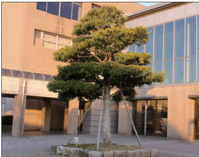
町木に決まった「もちの木」

健康づくりに努め、医療・福祉環境などの充実により、安心して元気に暮らせるまちづくりを進めるものです。