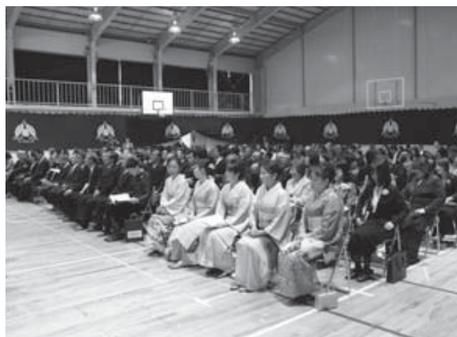
閉校式に訪れた卒業生たち