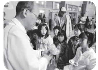
お花になるのかな?