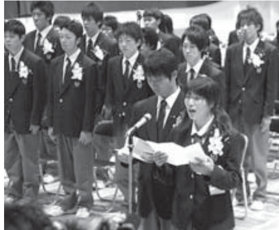
感謝の言葉を述べる大家君と林さん