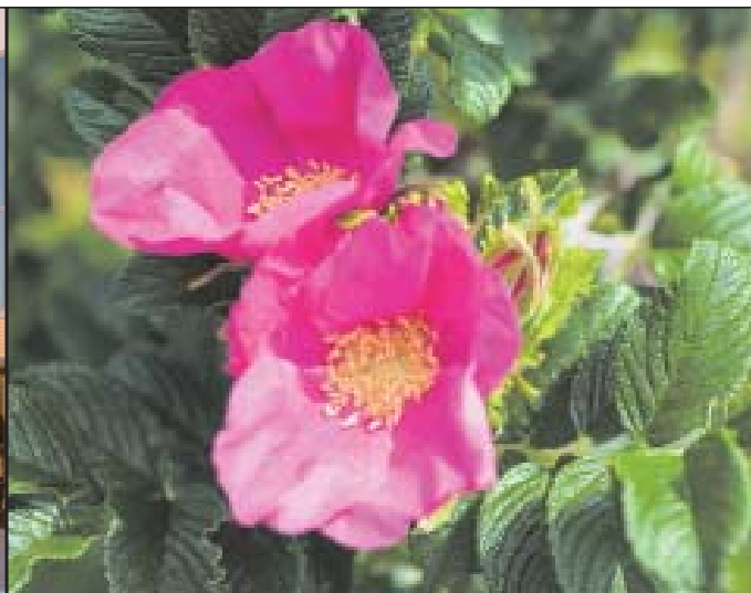
町花に決まった「はまなす」