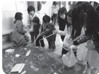
うまく釣れるかな?