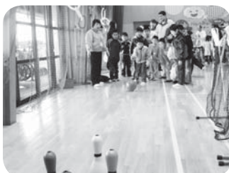
ストライクをねらって、それっ