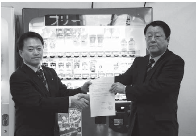
災害時に飲料水を無償提供する協定をかわす町長と松本本部長

同社は県内ではほかに10市町と協定を結んでいます。同様の自動販売機は総合体育館と富来活性化センターで合わせて3台が設置されました。