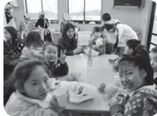
友達とおはぎを食べたよ