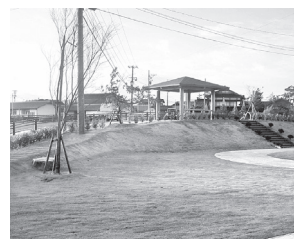
「浜の橋」公園の整備

いつまでも住み続けられる、住み続けたいまちの創造を目標に、地域資源を活用したまちの魅力向上と安心・安全・快適なまちづくりおよび地域コミュニティの醸成と住民主体のまちづくりを実践します。