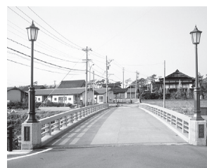
「浜の橋」の修景整備