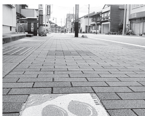
歩道に飾った中学生の作品