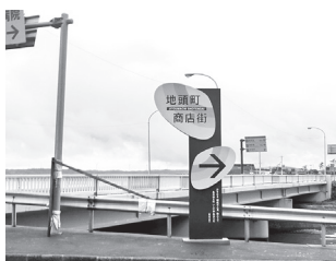
「富来地頭町」案内看板の設置