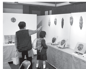
まちなかギャラリー