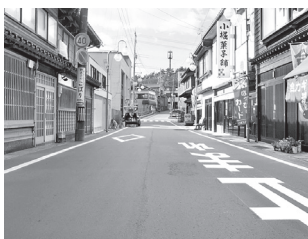
まちなか回遊軸整備