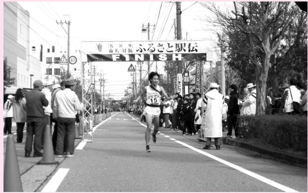
駅伝ゴールの瞬間