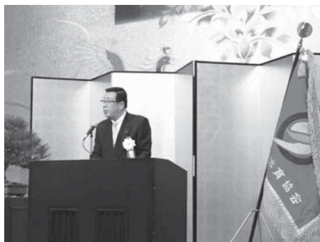
寺岡志賀町体育協会会長のあいさつ