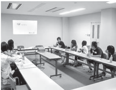
過去の実行委員会の様子