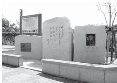
【坪野哲久文学碑】 高浜町 千鳥ヶ浜休憩所

【展示】 坪野哲久文学記念館 および公共施設で展示予定 【応募・お問い合わせ先】 〒925-0198 志賀町末吉千古一番地一 志賀町教育委員会生涯学習課 坪野哲久文学賞担当まで ☎32-1111 内線352