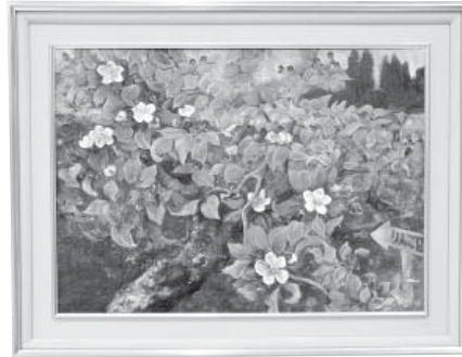
りんごの花 日本画 松原 美代子 (富山県)