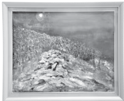
二子塚眠る (西海千ノ浦) 日本画 磯部 雄三 (白山市)