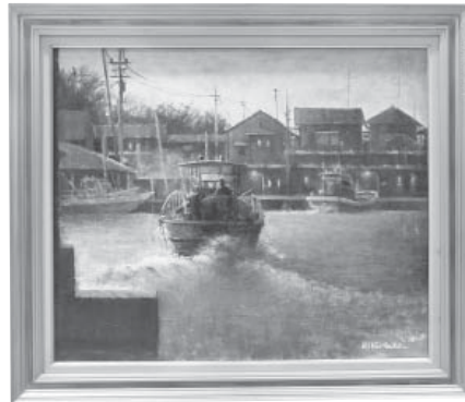
青い朝 洋画 中野 廣一 (白山市)