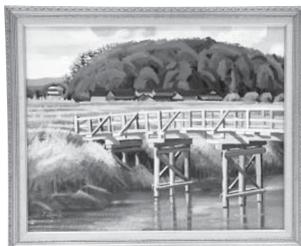
木橋のある風景 (清水今江) 洋画 出口 義美 (志賀町)