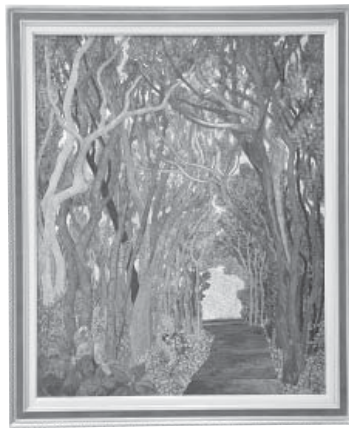
椿の森 日本画 大橋 由紀恵 (金沢市)