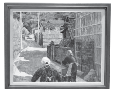
間垣のある坂道 洋画 田辺 孝一 (福井県)