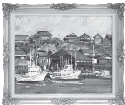
カナナ咲く頃 (風無) 洋画 浅瀬 由喜子 (七尾市)