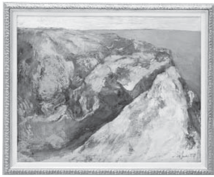
ヤセの断崖 洋画 村上 有輝 (金沢市)