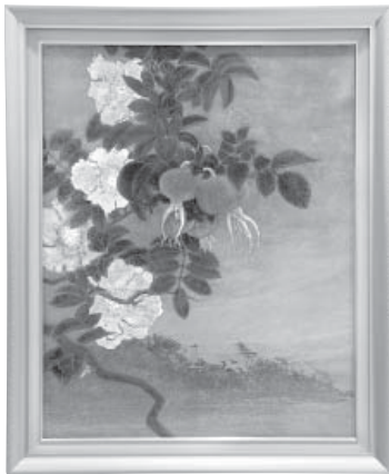
志賀町幻想 日本画 毛藤 東紀男 (金沢市)