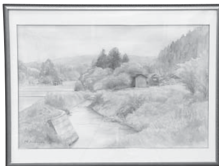
初夏の田園風景 水彩画 小堀 浩 (志賀町)