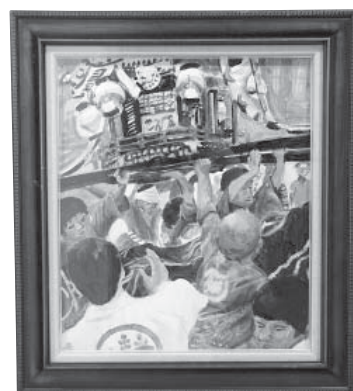
祭り (まつり) 洋画 平林 李緒 (金沢市)