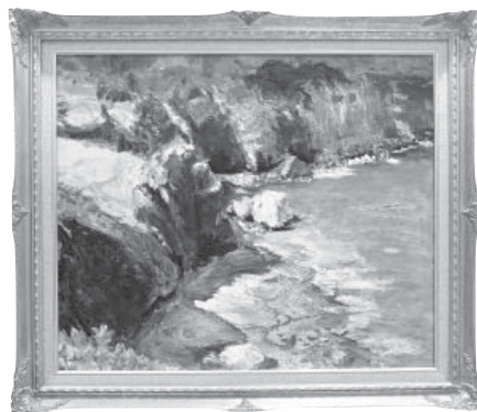
断崖 (前浜) 洋画 松浦 外美子 (金沢市)