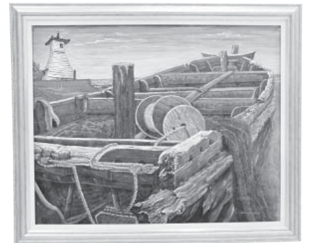
刻・福浦 洋画 竹中 外喜博 (かほく市)