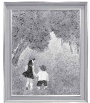
散歩 日本画 村田 栄子 (金沢市)