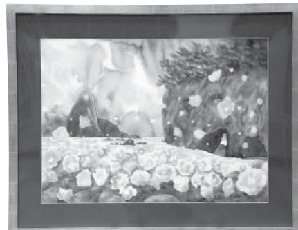
巖門に咲く波の花 水彩画 荒木 明日子 (金沢市)