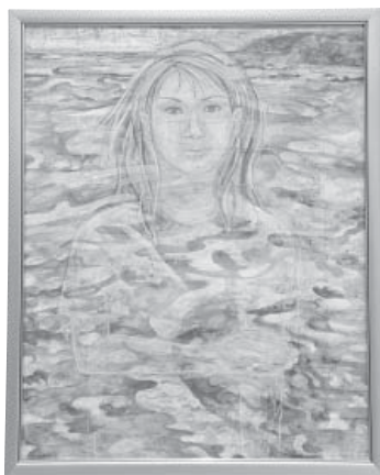
富来の海 日本画 若林 光江 (金沢市)