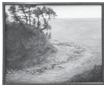
海を望むⅡ 洋画 高柳 惟 (金沢市)