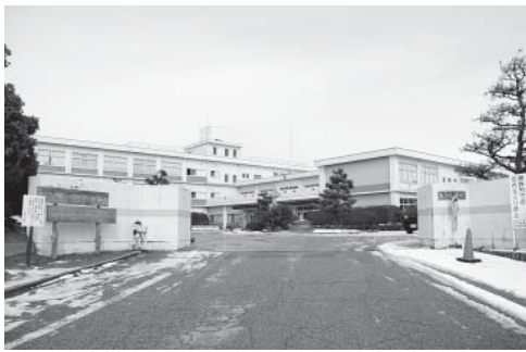
▲統合小学校が建設される現在の高浜小学校