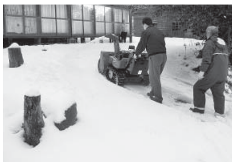
▲今年度から実施された高齢者世帯などの除雪

今年度は小型除雪機械を購入し、自力で除雪できない高齢者世帯などの玄関から道路までを除雪することとしている。料金は、1回につき500円程度と考えており、生活保護世帯および町県民税非課税世帯は無料とする予定である。