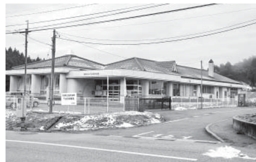
▲来年度から休止される保育園

問 空き校舎、空き保育園を高齢者のコミュニケーションの場として利用できないか。地元で運営し、町がサポートするような施策が必要である。