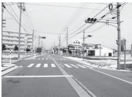
▲雇用促進住宅と高浜町地内商業地

問 雇用促進住宅の今後の取り扱いや高浜市街地における国道沿いの商業地の衰退をどのように考えているか。