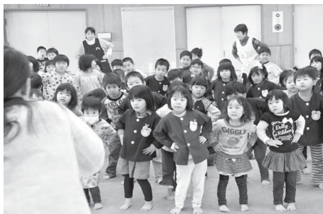
音楽に合わせて体操する高浜保育園の園児

「何回噛むといいですか」という質問に、「30回！」と児童は元気に答えました。最後に、食べ物が体の中を通して消化されていくことをイメージした体操を楽しく踊りました。