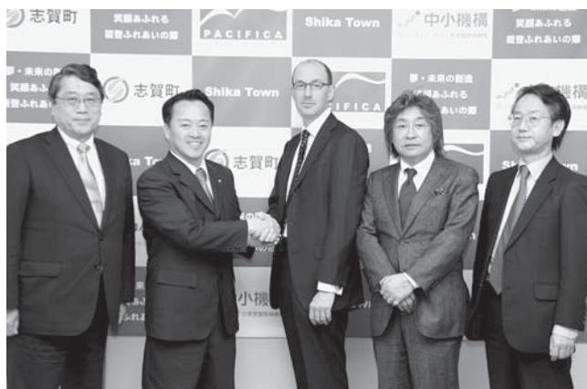
小泉町長（左から2番目）と握手するサルキン社長（中央）