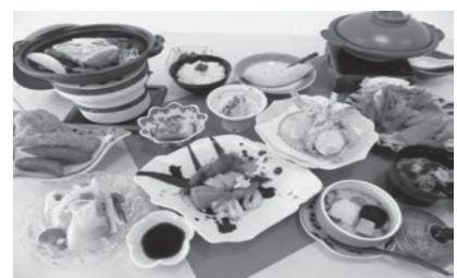
お手軽会席プラン お一人様 4,500円