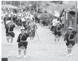
五重塔まつり実行委員会 ☎ 0767-27-1226