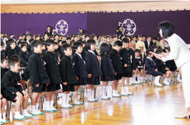
元気に返事をして立ち上がる新入生(高浜小学校)