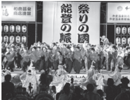
和倉温泉観光協会 ☎ 0767-62-1555