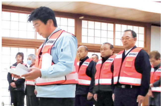
決意表明を読み上げる坂本副隊長(手前)と隊員ら

昨年5月、初めて区全域を対象に実施した防災避難訓練を、今年の5月11日にも行う予定です。