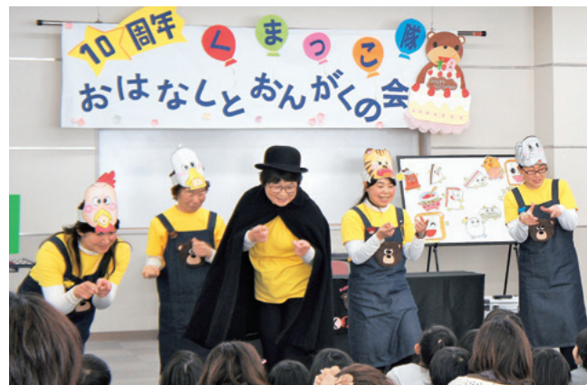
おそろいのエプロン姿で歌うくまっこ隊

30～70代のメンバー全員で、絵本のほか、外国の作品や町内の民話を取り上げ、ピアノやバイオリン演奏も行いました。マジシャン・ルパンや町のゆるキャラ「西能登あかり」ちゃんも参加し、たくさんの親子などが楽しみました。