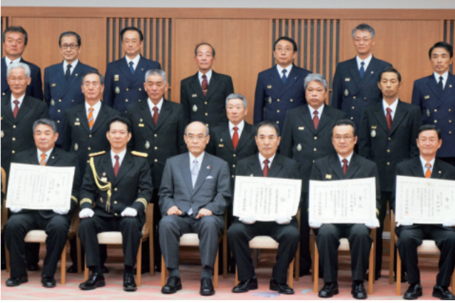
消防庁長官定例表彰の皆さん