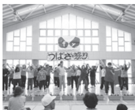
つばさ祭り実行委員会 ☎ 0767-74-2055