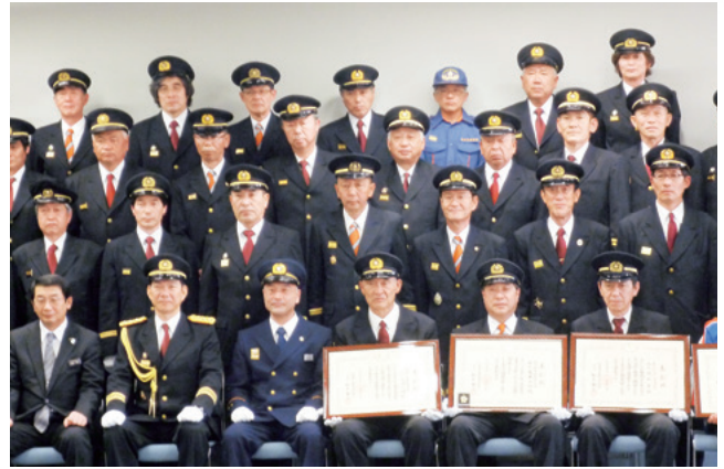
日本消防協会会長表彰の皆さん