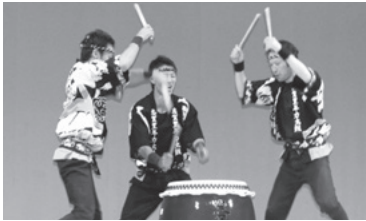
過去の初夏の文化祭の様子