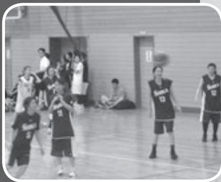
バスケットボール（一般女子）