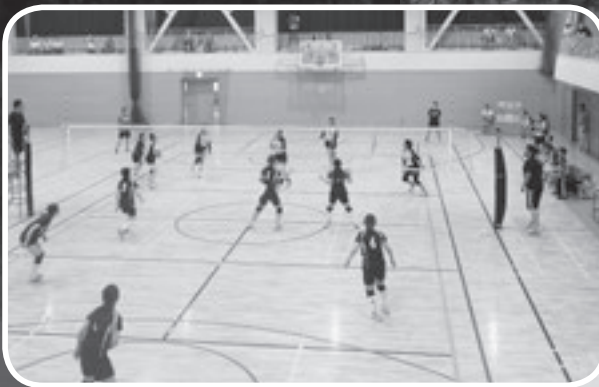
バレーボール（一般女子）