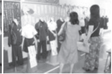
体操服の展示アンケートの様子