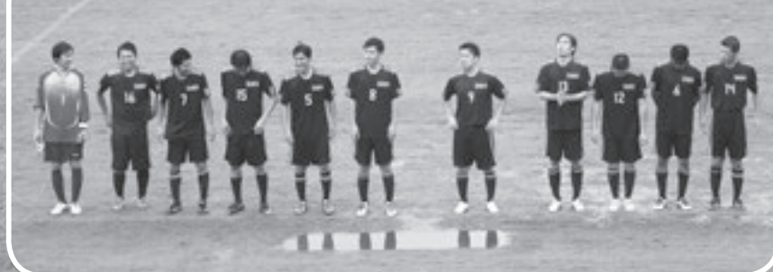
サッカー（一般男子）