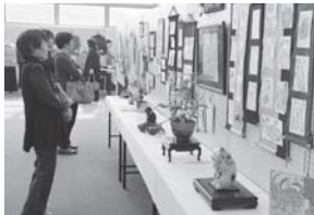
図宝達志水町生涯学習課 ☎ 0767-29-8320