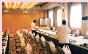
「能登ロイヤルホテル」での実習