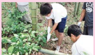
「農家民宿こずえ」での実習