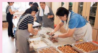
PTAの五目いなりと肉巻きいなり