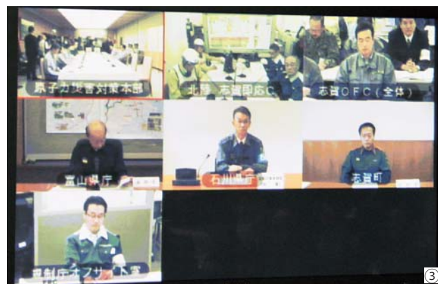
① 5 km 圏内のお年寄り役など 11 人が、武道館に避難。放射線を防ぐ鉛のカーテンを閉めた。② 対応に追われるオフサイトセンター。③首相官邸と関係機関を結ぶテレビ会議。④⑤県立看護大学(かほく市)で放射線汚染の有無を調べるスクリーニング検査。⑥自衛隊による逃げ遅れ住民の避難措置。⑦避難用バスに乗車する児童。