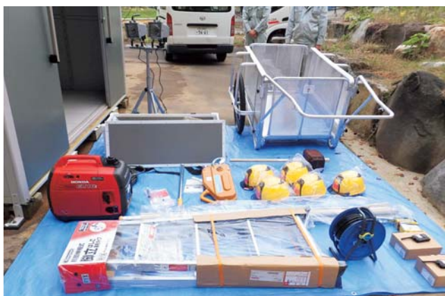
▲投光器、発電機、ハンド型メガホン、トランシーバー、リヤカー、救助工具などの防災関連備品を配備しました