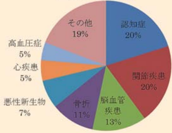
介護が必要となった原因 (平成25年度)

認知症は、早期に発見し、適切な治療や対応をすることで症状を軽くしたり、進行を遅らせることができます。また、介護保険制度の利用や地域住民の認知症に対する正しい理解と支援により、住み慣れた地域で暮らしていくことも可能です。「これって認知症?」「もの忘れが最近ひどくなってきた様子…どうしたらいいの?」など、認知症に関する相談がありましたら、地域包括支援センターまで気軽に連絡してください。