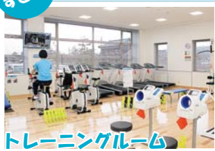
トレーニングルーム

ランニングマシン、エアロバイク、油圧式マシンなど最新マシンが入りました！筋肉量や脂肪量が分かる測定器InBodyも導入。専門スタッフが、運動アドバイスを行います！