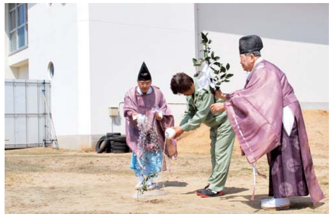
工事の安全を願って執り行う神事の様子

志賀地域の放課後児童クラブ2カ所を1カ所に集約し、来年4月に開校する志賀小学校隣に新設します。対象が1～3年生から1～6年生までに拡大され、平成28年4月1日に運用を開始します。施設は、鉄筋コンクリート一部木造平屋建て、延べ床面積約800㎡です。プレイルーム3部屋・フリースペース1部屋が備えられ、約200人が利用できます。総事業費は3億5,748万円となっています。