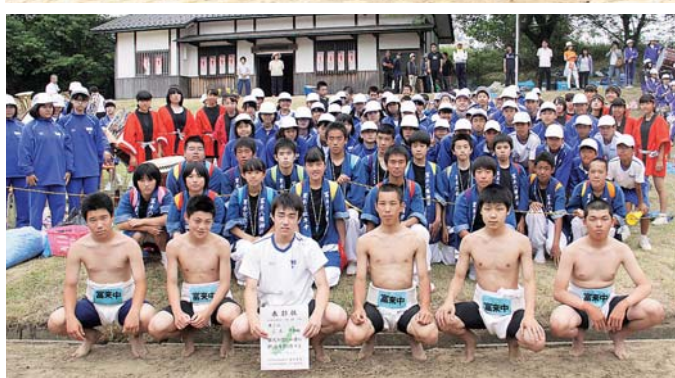
富来中学校：団体3位