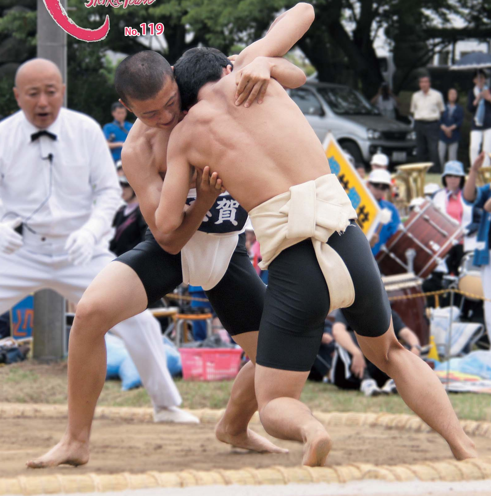
photo : 羽咋郡市中学校相撲大会