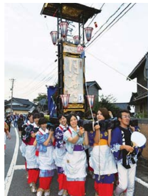
昨年の西海祭り体験ツアー

昨年からは、町外大学生がキリコを担ぎ、ヨバレに参加する「西海祭り体験ツアー」を開催。金沢市近郊の大学生を中心に募集し、昨年は26人が参加しました。今年も募集