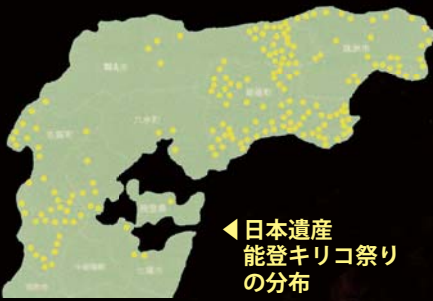
◀日本遺産 能登キリコ祭りの分布

神輿と違い、キリコはそれぞれの思いを込めて作るため、形は10種類以上。ルートとされるのは「笹キリコ」で、輪島の子ども用キリコとして現在もあります。シンプルなもの「レンガク」、竹を使った「竹キリコ」、武者絵が描かれた「武者絵キリコ」をはじめ、多数の提灯を飾った「提灯キリコ」、人形を飾りつける「人形キリコ」といったものがあります。他にも地域により、50基以上のキリコが担ぎ出されるもの、重さ4t・屋根12畳分とキリコの巨大さを誇るもの、キリコが海中で乱舞するもの、30mにもなる柱松明を練り回すものなどさまざま。