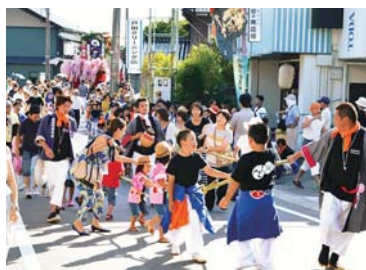
観客も曳山を引くことができる本祭り