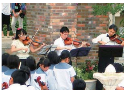
④交流演奏会で一生懸命演奏する児童 ⑤50年ぶりに復活したバイオリンの演奏

4年から6年生で構成するニコニコストリングスメンバー15人は、管弦楽団オルビスNOTOの団員からバイオリンを教わっています。 当日は、女子メンバークラスが参加。落ち着いた様子で4曲演奏し、日頃の練習の成果を発揮しました。福井市社北小弦楽クラブ・オルビスジュニア・つばさの会音楽クラブとの交流演奏も大成功しました。昼食時には、他の児童楽団員と一緒に昼食を食べるなど、楽しく過ごしました。