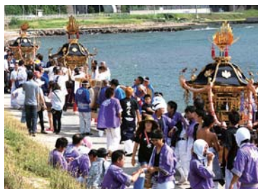
領家浜(増穂浦)に神輿11基が並ぶ浜回り

集。町外の若者が、西海祭り特有の衣装を着て祭礼を体感し、能登に受け継がれる伝統文化を深く理解することで、交流人口拡大と地域の情報発信を図っています。