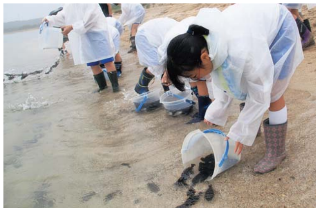
ヒラメの稚魚を浜辺に放流する児童ら

山方が勝てば豊作、浜方が勝てば豊漁と云われ、今年は、序盤から勢いのあった山方が勝利し、「豊作」となりました。