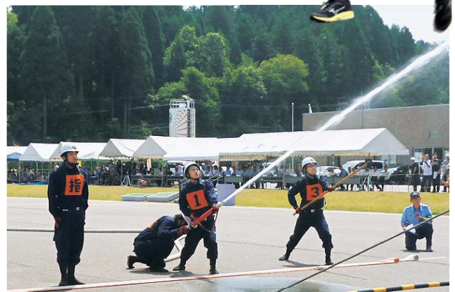
優勝した末吉自警団

優勝 : 末吉自警団 準優勝 : 大念寺自警団A 敢闘賞 : 二所宮自警団、志賀原子力発電所自衛消防隊B 米町自警団