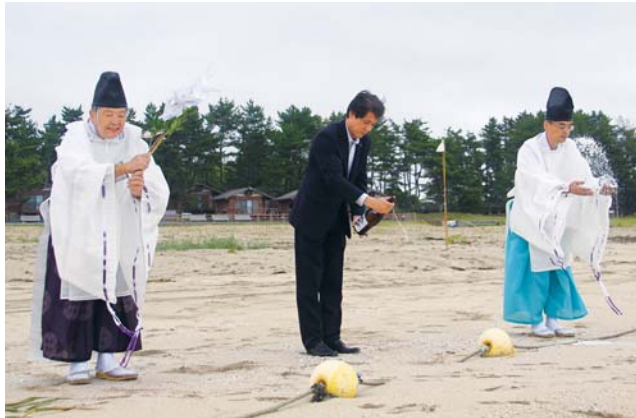
お神酒と塩をまいて海水浴客の安全を祈る