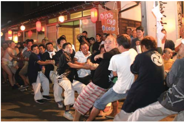
綱に飛び付き、山方と浜方に分かれて引き合う住民