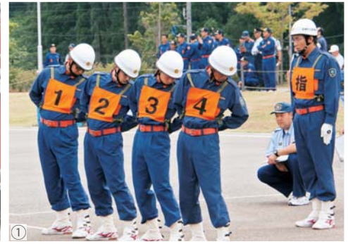
【分団名】 ①土田 ②堀松 ③福浦 ④稗造 ⑤東増穂 ⑥加茂 ⑦富来 ⑧西海