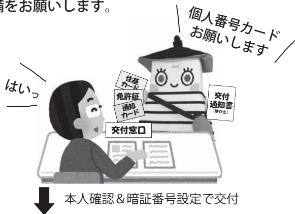
本人確認&暗証番号設定で交付

（*）：平成 29 年 1 月から利用開始予定の「情報提供等記録開示システム（愛称：マイナポータル）」により、自宅のパソコンから自分の情報が不正・不適切に照会・提供されていないか、確認することができるようになります。