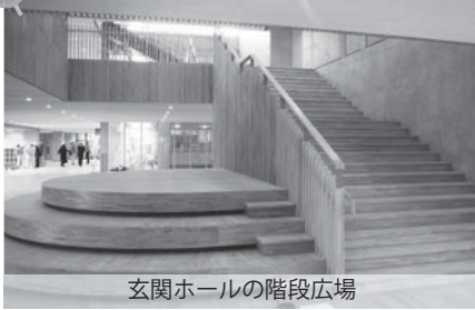
玄関ホールの階段広場