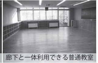
廊下と一体利用できる普通教室