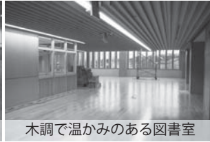
木調で温かみのある図書室