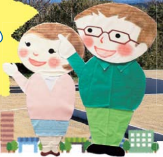
みらいさん とうぶくん