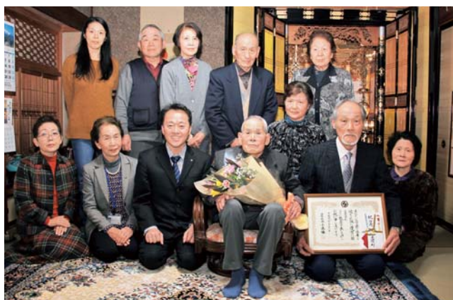
家族らに囲まれ、祝福を受ける田舎さん