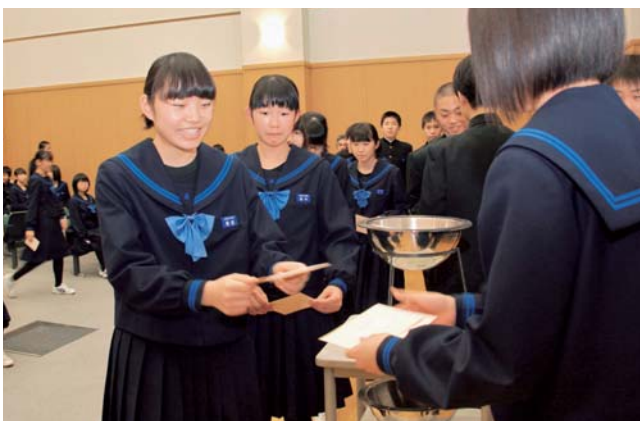
二十歳の自分へ宛てた手紙をタイムカプセルに入れた