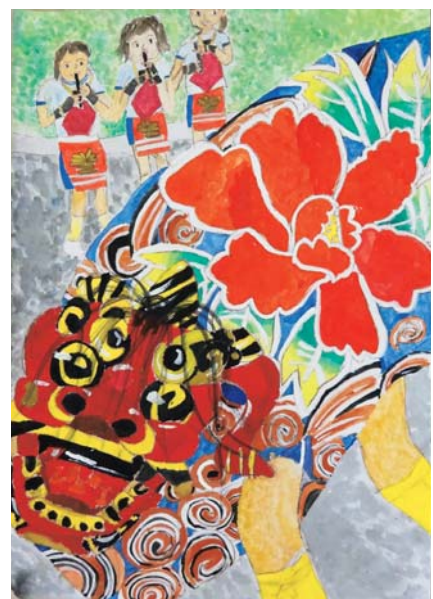
『迫力満点！堀松の獅子舞』