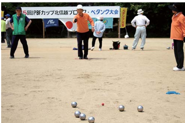
日頃の練習の成果を発揮する選手

各県持ち回りで開催し、石川県では初めての開催です。県大会を勝ち抜いた石川、富山、福井、長野、新潟県の選手32チーム96人が一堂に集まり、ペタンクの腕を競いました。大会では、長野Cが優勝。県勢は、ベスト16が最高でしたが、地元協会員が本大会の準備や運営などを懸命に行い、有意義な大会となりました。