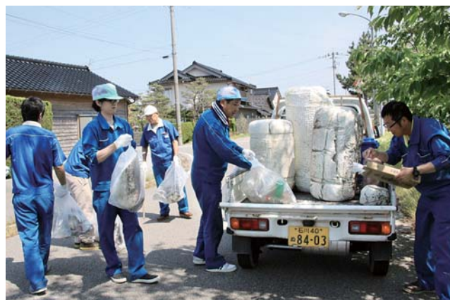
たくさんのごみを拾い集め、トラックに乗せる社員

社員71人の有志が作業着姿で集まり、志賀町文化ホールを起点に2グループに分かれ、約2.2km区間を1時間半ほどかけて清掃しました。道沿いに落ちていたペットボトルや空き缶のほか、於古川付近に流れ着いた発泡スチロールなど大きなごみも拾い上げ、約120kgにもなるごみを収集しました。