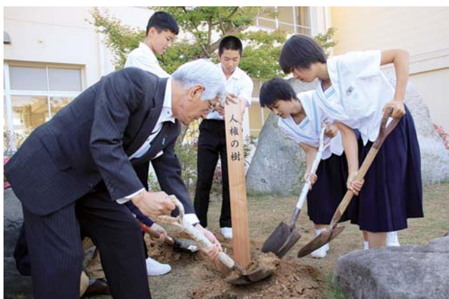
「人権の樹」の標柱を設置する児童と人権擁護委員

この日、人権教室も開催され、生徒126人がスマートフォンの正しい使い方を学んだほか、人権擁護委員による人権作文コンクール作品の朗読に聞き入りました。