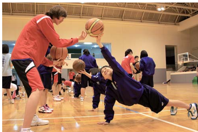
選手の指導で、バスケの基本メニューをこなす児童生徒

志賀中学校男女バスケットボール部と富来ミニバスケット教室から計30人が参加。選手からボールをコントロールする指導を受け、悪戦苦闘しながらもこなし、選手の高度な技術には歓声を上げていました。バスケットで交流を深めた後、記念撮影やサイン会を行いました。