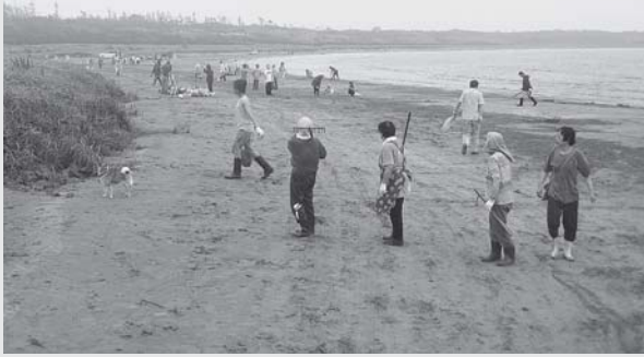
海岸清掃に汗を流す参加者の皆さん

千鳥ヶ浜海岸清掃を、7月17日(日) 早朝6時から約1時間実施しました。あいにくの天候となりましたが、高浜地区と中甘田地区の子どもから大人まで約300人が参加しました。約1時間の作業でしたが、皆さんのローラー作戦で、高浜新港から大島諸願堂までの約1.9キロの区間は見る見るうちにきれいになりました。毎年恒例となっている「千鳥ヶ浜海岸清掃」ですが、この清掃が契機となり、「自然を愛し、美しいまちをつくる」という思いが、さらに町じゅうに広がっていったほしいと思います。参加者の皆さま、お疲れさまでした。関係の皆さまにはご協力をいただき、厚くお礼申し上げます。