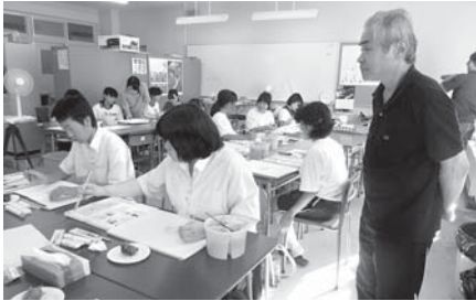
①志賀町の風景を描く美大学生 ②美大教授による絵画塾（志賀高校にて）