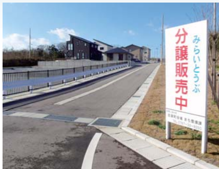
定住促進住宅地みらいとうぶ