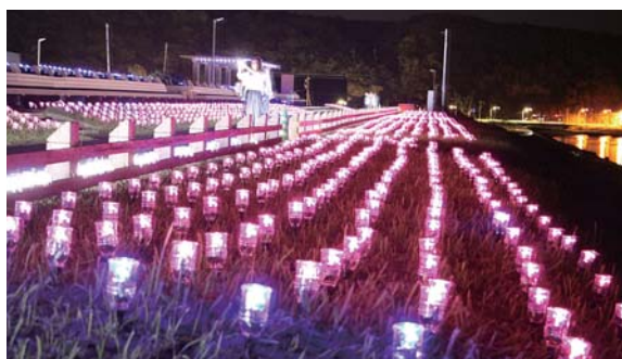
西能登里浜イルミネーション・ときめき桜貝廊

観光客が減少する冬期間の誘客促進を図るため、増穂浦海岸で、昨年10月1日から「西能登里浜イルミネーション・ときめき桜貝廊」を実施しています。ホームページやSNSでのPR効果などもあり、町内外から多数の方々にご来場いただいています。1月10日まで開催いたしますので、ぜひご覧いただきます。