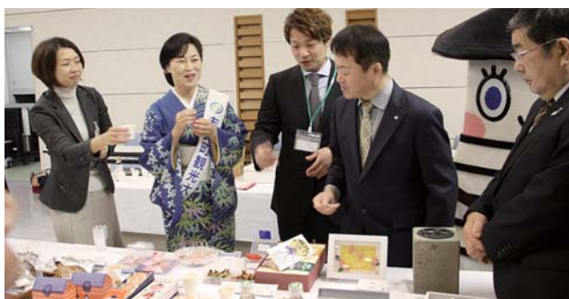
昨年の12月2日に開催した志賀町優良特産品発表会

ふるさと納税の返礼品として活用している優良特産品は、昨年10月の審査会で、新たに41点を推奨し、前年の21点を加えると計62点となりました。