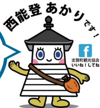
日本最古の木造灯台「旧福浦灯台」がモチーフ