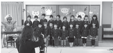
住警器仮面の演奏で合唱【とぎ保育園】

住宅用火災警報器の設置義務化から10年経ちました。志賀消防署では維持管理ソング『住警器のおかげ』を制作しました。この歌は町内保育園・幼稚園の園児に合唱してもらいました。中には『点検してみたい！』とうれしい声を聞くこともできました。合唱の様子は、しかチャンネル(9ch)で放送中です。皆さんも、『もしも』に備えて、自宅の住宅用火災警報器を点検しましょう。