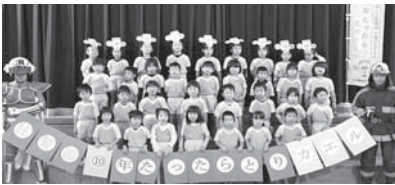
消防士も一緒に【すばる幼稚園】