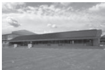
志賀放課後児童クラブ