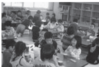
富来放課後児童クラブ