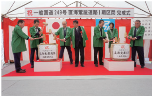
I 期工事の完成を祝い鏡開き

完成式の後はアトラクションとして、中高生が米町獅子舞を披露。地元女性の会による振るまい鍋やサザン飯・たこ飯がふるまわれました。