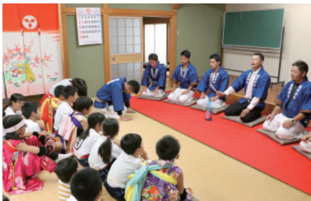
地区住民に嫁ほめ詞を披露する青年団員