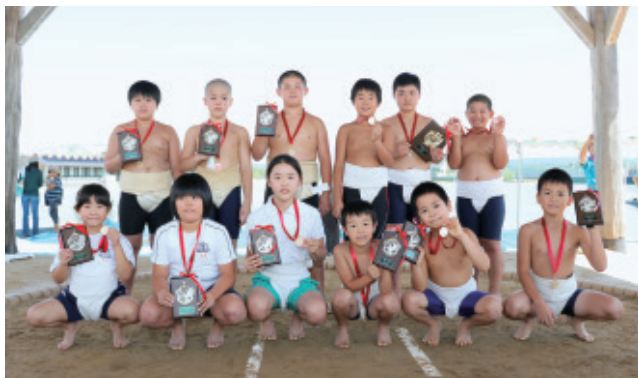
団体戦と個人戦で優勝した児童