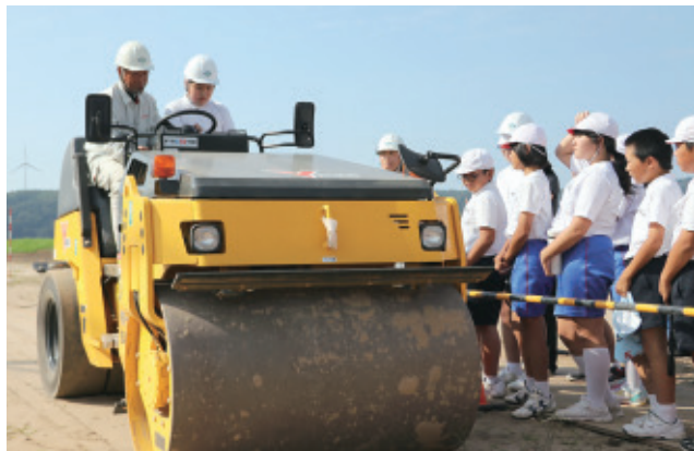
ロードローラーの運転を体験する児童

児童たちは、農地整備の概要についての説明を受けた後、情報通信技術を取り入れたパワーショベル、ブルドーザー、ロードローラーの運転を体験しました。