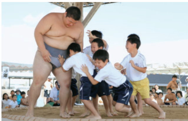
高校生に挑む児童たち