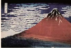
「富嶽三十六景 凱風快晴」葛飾北斎 ※通称「赤富士」

葛飾北斎の代表作の1つ「富嶽三十六景」の赤富士や「北斎漫画」など、バラエティ豊かな作品を紹介。北斎に私淑したフランス人画家や弟子の作品も加え、北斎芸術の全貌に迫ります。