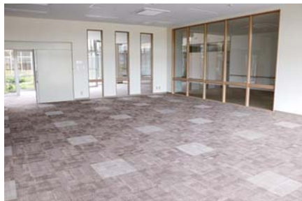
トレーニングルーム