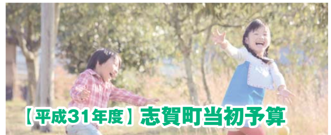
【平成31年度】志賀町当初予算