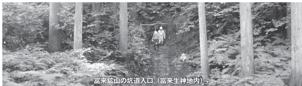
富来鉱山の坑道入口 (富来生神地内)

また、東京五輪のみならず、大学生などのスポーツ合宿を通して、交流人口の拡大や国際交流を促進し、地域の活性化につなげていきたい。