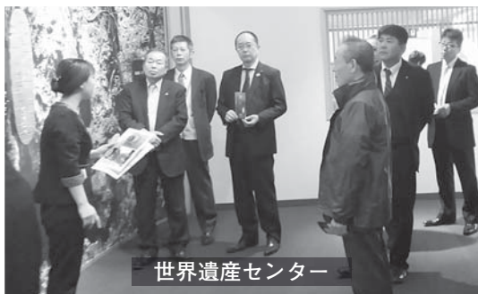
世界遺産センター

富来鉱山の開発は、できれば国や県と共同で行うことが望ましく、町執行部には、今後の方向性について、慎重に検討してほしいと思います。