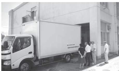
改修される昼食搬入口

答弁 志賀高校への昼食提供は、高校を存続するために町が行っている施策であり、町が面倒を見ることで県から改修許可をもらっている。