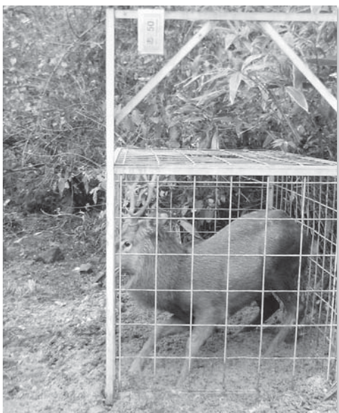
捕獲されたニホンジカ（尊保地内）

予算額は、農地の形状や耕作状況なども異なることから、延長を推計することは困難であり、費用を積算することはできない。檻わなの数は、現在、町から80基貸し出しており、要望があれば対応していきたい。