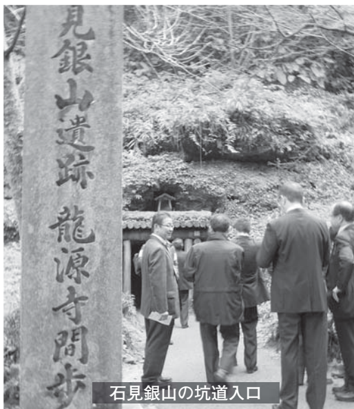
石見銀山の坑道入口