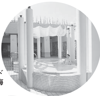
シーサイドヴィラ渤海