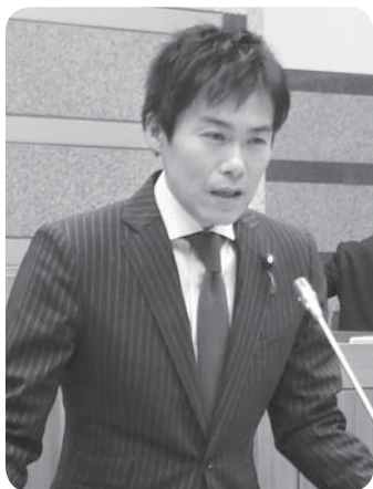
稲岡 健太郎 議員

稲岡 近年の人手不足は業種・官民を問わない状況だ。地方公務員の時間外勤務に関する調査では、民間事業所よりも超過勤務が多い結果となった。