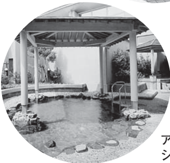
アクアパークシ・オン