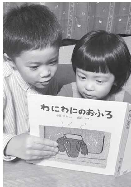
読書で脳を活性化!

稲岡 公共図書館や学校の図書室で、読書通帳の導入が進んでいる。読書通帳とは、金融機関のATMのように専用の通帳に借りた本の情報を記録できるもので、これを導入したある図書館では児童図書の出し数が約2倍に増加した。