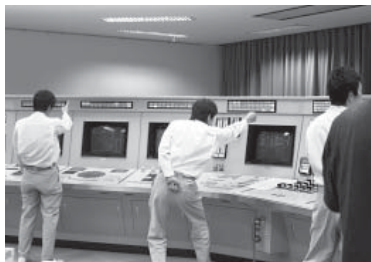
電源喪失時の対応訓練の様子