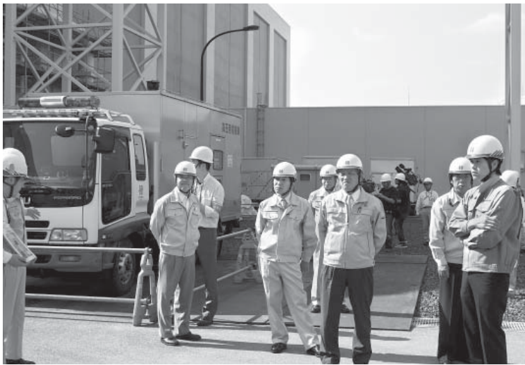
全交流電源喪失時の電源確保の対応を確認する議員（左に見えるのが非常用電源車）

当議会は、6月8日、志賀原発の津波に対する安全強化策の確認のため現地視察を行いました。消防ポンプ車を使った