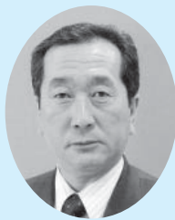
久木 拓栄 議員