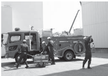
消防車による原子炉・使用済み燃料プールへの注水訓練