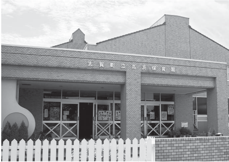
来年4月から指定管理者制度が導入される高浜保育園