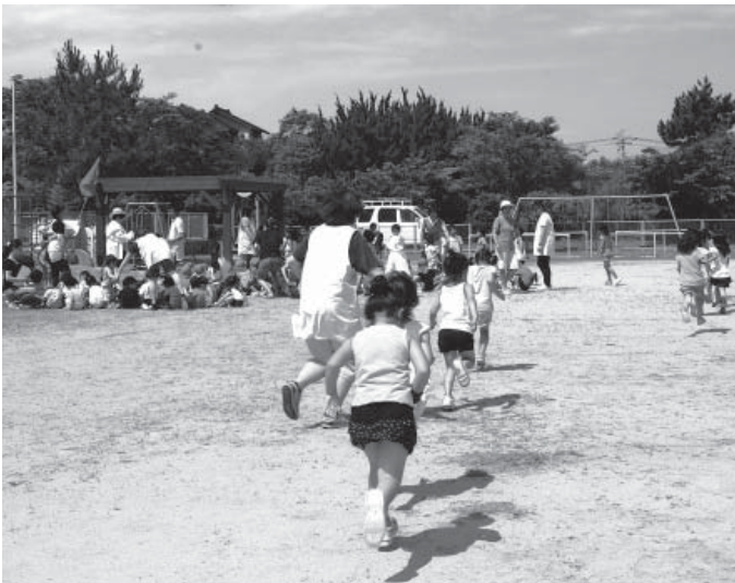
町の各保育園では、いろいろな災害を想定した安全管理マニュアルが策定されている。(写真は高浜保育園で行われた地震を想定した避難訓練)

小中学校の危機管理対策は、火災避難訓練のほか、防犯、地震、原子力等の訓練を、それぞれ年1回以上、実施している。東日本大震災を教訓として、現在あるマニュアルや津波ハザードマップの配布を行い、より現実的、具体的に実施する。地区ごとの特性を考慮し、防災放送後の初動体制や登下校時の避難対策について強化し、地震、津波を想定した避難訓練を早急を実施する。