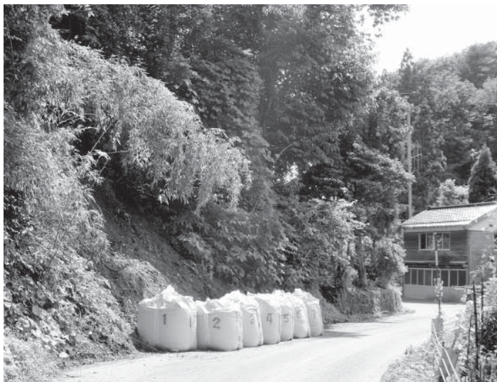
大雨で土砂が崩れ片側通行となっている県道輪島富来線。地域住民にとって生活道路であり防災上も重要な道路である。