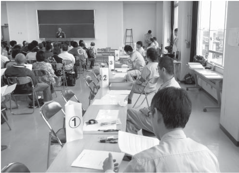
宮城県名取市で開かれた仮設住宅説明会。手前の受付2人は、当町から派遣された町職員。弔慰金や仮設住宅の申請手続きなどを行った。

質疑 東日本大震災支援事業の被災地現地派遣に293万円。計画的なもの。 答弁 職員の状況もあり、今のところ1年のような長期の派遣は想定していない。