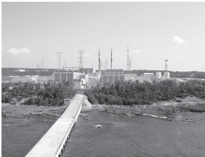
現在、2基とも運転が停止している志賀原子力発電所