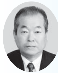
櫻井 俊一 議員