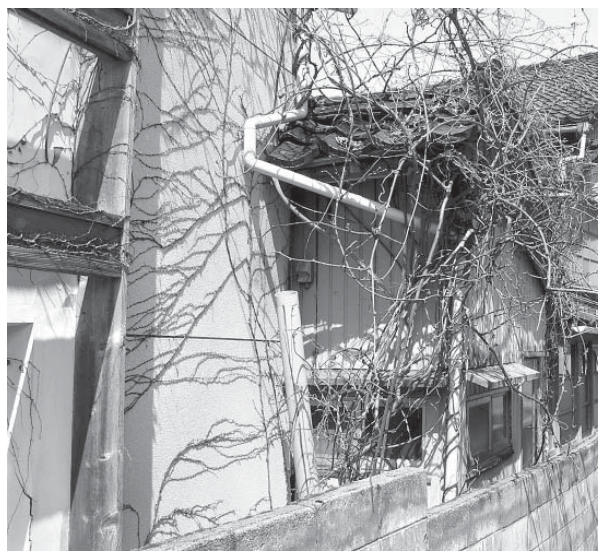
住民が居なくなり手入れがされていない家屋。災害の際に隣接家屋に被害を及ぼすのではないかと懸念される。

【町長】 空き家は災害に対して弱い面があるが、空き家を含め、浸水想定区域そのものが危険区域であり、現地を改めて調査する必要性はないと考える。【南】 今回作成されるハザードマップには、当然、避難場所等が明記されると思うが、現段階で、どれくらいの詳細が盛り込まれているのか。【町長】 集落を標高別に色分けした浸水想定区域や津波一時避難ビルを表示するほか、主要な避難所等を記載する。