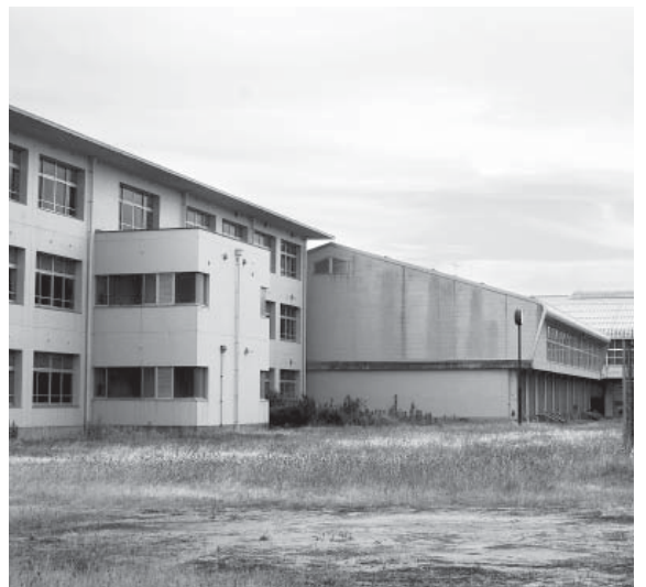
旧富来高校。今後、校舎棟の大規模改修や体育館の耐震改修工事も必要。

質疑 地域支え合い体制づくり事業とは、どのようなことをしようとしているか。 答弁 基本的には障害者、一人暮らし老人を対象。社会福祉協議会には民生委員台帳、障害者の方の台帳がある。それらの情報を統括して、町の地図システムと合わせる。登録制でするつもりであるが、統一することで、災害時や緊急時に、関係者に迅速な情報を提供できる。