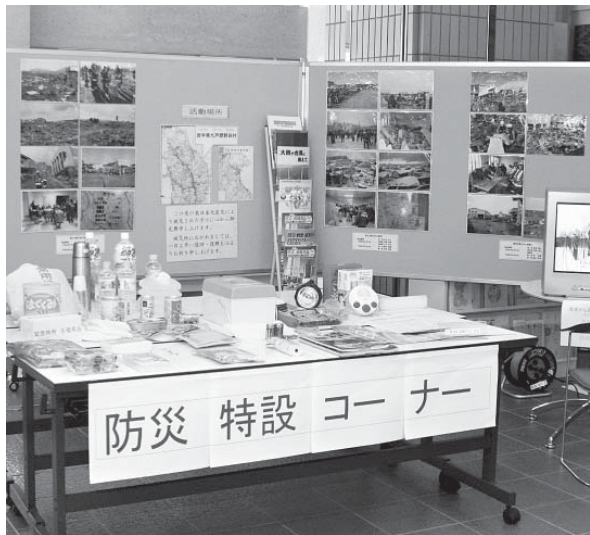
東日本大震災後、役場1階に設置された防災特設コーナー。いろいろな機会を通じて町民の防災意識の高揚を図ってほしい。

【南】 今回の東日本大震災で、住民の防災意識が高まったことは間違いない。今後、町民の防災意識に関する啓蒙活動、啓蒙教育をどのようにして実施していくのか。