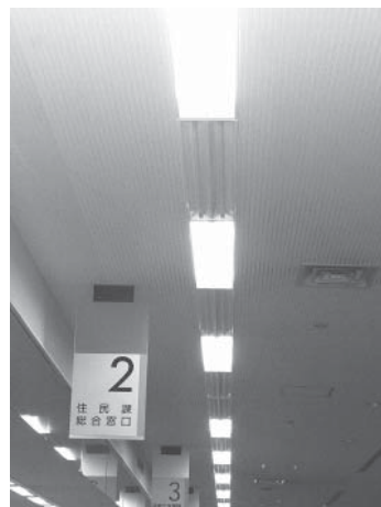
節電対策で蛍光灯を一つおきに外した役場1階の照明。各課で節電推進員をおいて節電の徹底に努めている。

林 昭和40年代から志賀町と北陸電力は、町づくりで、共存共栄の関係を築いてきた。その北陸電力が今夏の電力供給に関して困難に直面している。全町的に節電に協力し、同時に自然エネルギーにも取り組んでいる町としてのイメージを発信すべきと思うが、対策はとられているのか。 町長 平成22年3月に町地球温暖化対策実行計画を策定し、各行政施設で省エネに努めている。今後の節電対策については、広報やケーブルテレビを通して、住民や事業所に対して啓蒙活動を実施する。