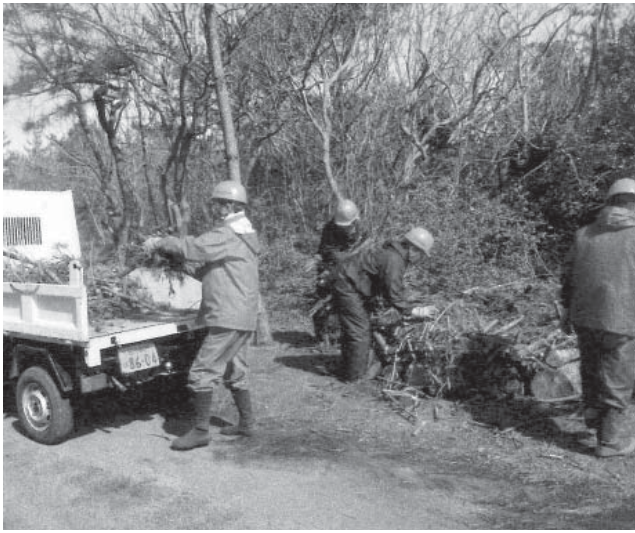
緊急雇用創出事業として、公園や公共施設の整備、道路の除草、枯れ松撤去等の業務を行った。

質疑 観緊急雇用創出事業は交付金事業か。減額になったお金は、次年度へどのようにしてもっていくのか。