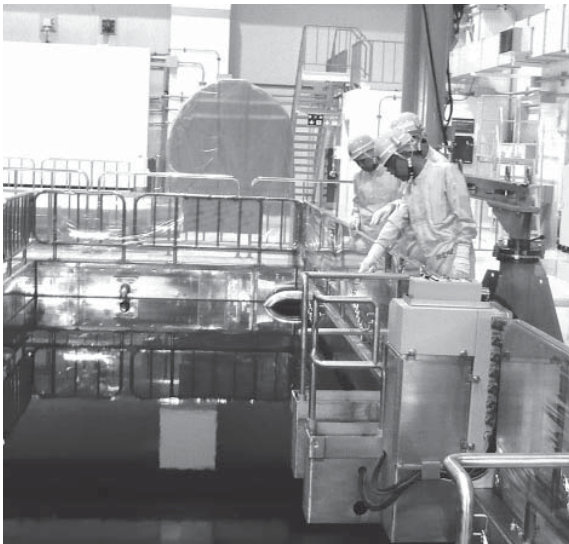
志賀原発1号機の使用済燃料プールの状況の監視を行う町生活安全課職員。

町長 誘致した自治体の責任として、町民の安心・安全を守り、事故が起らないようしっかりとした体制や監視が続けていく。