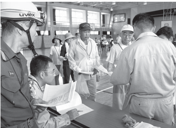
高浜地区の住民が参加して行われた原子力防災訓練。 (平成18年8月、旧高浜中学校体育館)

町長 町単独ではできない。国・県、近隣自治体と連携を図りながら、住民の安全を第一に考えた防災訓練を行いたい。 今後は、あらゆる事象に対応した実効性と現実味のある訓練を実施しなければいけない。