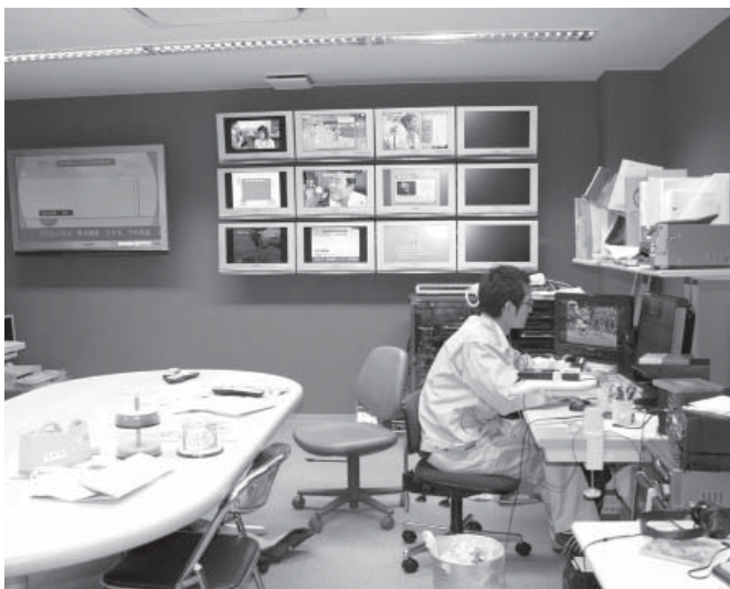
6月1日から本放送を開始したケーブルテレビ事業。リアルタイムで町のさまざまな情報を伝えることができるようになる。写真はネットワーク放送センター

さらに、テレビ放送とホームページとの連動化を計画しており、リアルタイムでの情報発信、内容の一元化を図りたい。