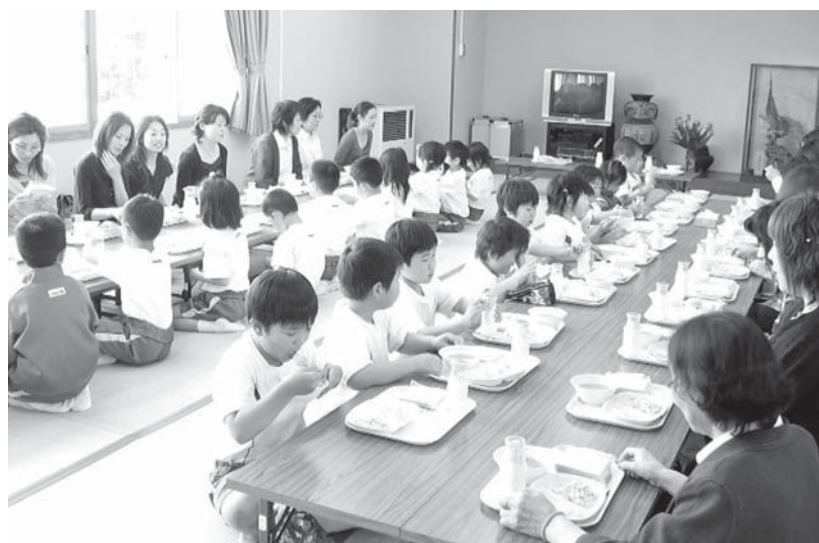
地域に根ざした学校給食を通じた食育の推進が図られています。(写真は土田小学校の親子給食試食会)

今後も、地場農産物の活用については積極的に取り組み、栄養バランスのとれた食事を提供していく。