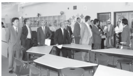
明るく開放的な図書室。

今年1月に24億円をかけて完成したばかりの新しい小中一貫校である。 現在は第1〜7学年の生徒415人が学んでいるが、将来は第9学年までの850人規模になるとの説明があった。 カナダでは、日本の文部科学省のように国レベルで教育を管轄する機関はなく、教育の管理・運営にかかわることはすべて州政府の教育省が行う。そのため、州によって教育制度が異なる。