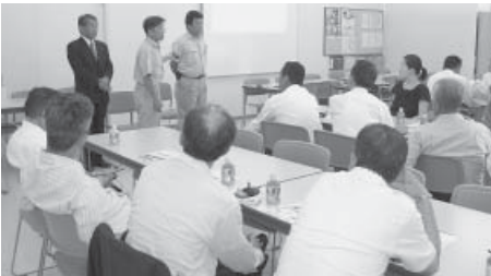
コマツ金沢工場の事業内容の説明を受ける 両町議員。

金沢港の大水深岸壁の 整備により、暫定供用さ れれば、金沢工場から直 接世界各地へ製品を輸出 できるようになります。