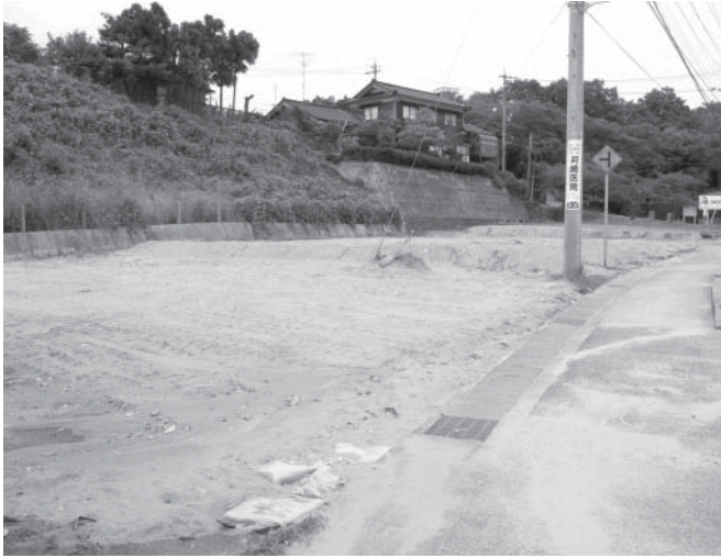
建物が取り壊され、更地にして売り払う予定の旧堀松給食センター跡地(堀松地内)。