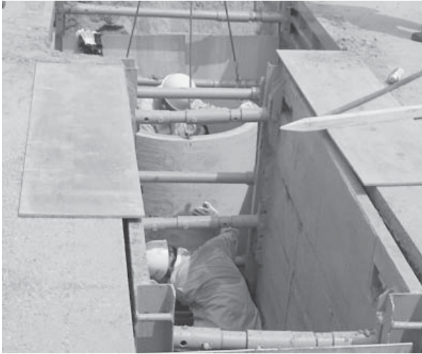
着々と整備が進められる公共下水道事業