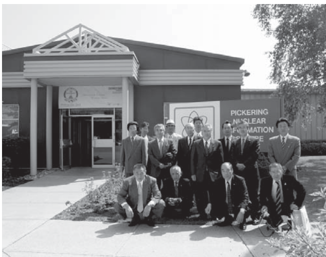
ピカリング原子力発電所情報センター前で。日本のPRセンターのようなものだが住民からの苦情等はこちらで受ける。

その後、トロントの東に位置するピカリングまで移動し、ピカリング原子力発電所の情報センターを視察した。