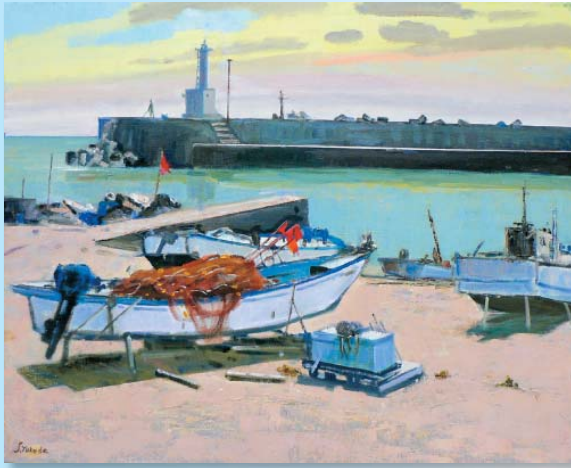
作品名「茜さす風無」