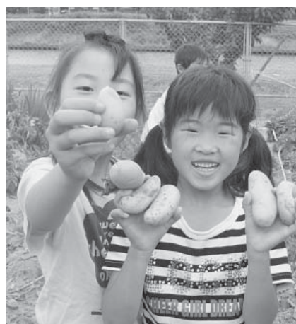
この子らが大きくなったときに住みたい、住んで良かったと思う町づくりのために、検討すべき課題は沢山あります。(写真は児童館じゃがいも掘り)

全町エリアを対象にすることは現時点では好ましくないが、人口流出対策や地域コミュニティの在り方については大変心配であり、重要課題だと認識をしている。別の角度から捉えながら対応していきたい。