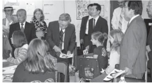
児童から視察者全員に友と書いた紙が贈られた。

当日は選択科目で日本文化をフランス語で教えている授業を見学し、児童らのかわいい歓迎を受けた。