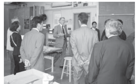
ベルモント高校長から説明を受ける。