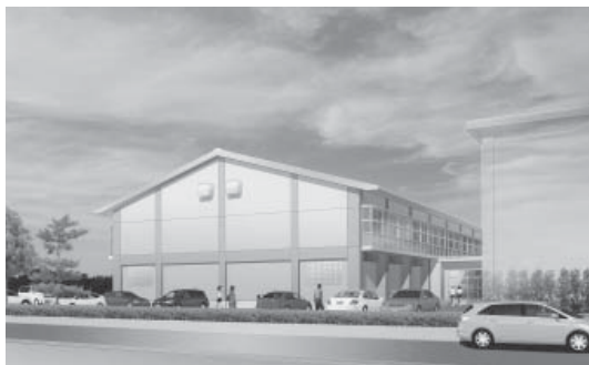
富来小学校体育館完成イメージ

定住促進住宅地造成事業 (造成工事) 第2回臨時会では、工事請負契約の締結の議案2件が審議され、いずれも全会一致で可決しました。 1工区として開発区域面積10・3ヘクタールで分譲戸数55戸の区画、道路、水路、調整池等の造成を行う。寺井・林特定建設工事共同企業体と3億8245万円です請負契約を締結。