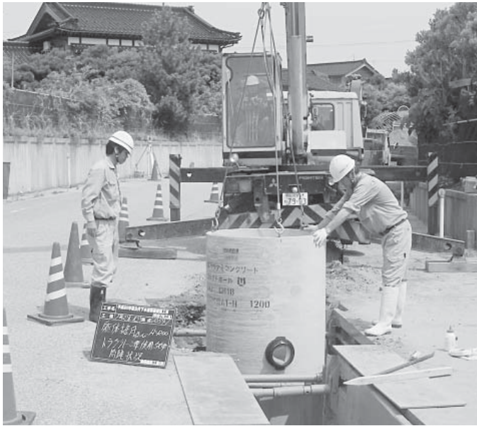
公共下水道工事（大島地内）

19年度の各会計補正予算は、事業費の確定および精算等に伴うものであり、いずれも3月31日専決処分したものです。 一般会計では、地方交付税等の確定による増額分を財政調整基金や特別財政基金の積み立てに充て、歳入歳出それぞれ1億8245万円を増額補正し、総額171億596万円となりました。