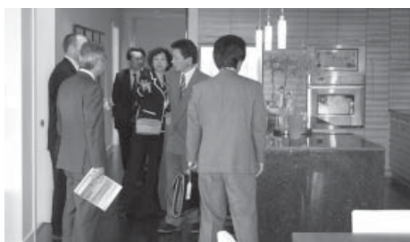
宅地造成地内のモデルハウスを視察する議員ら。

コールウッド市はブリティッシュ・コロンビア州の州都ビクトリアのベクトタウンで、人口約1万4千人。自然と先住民文化を大切にし、観光に力を入れているまちである。 議会議員は6人であり、任期は3年である。選挙権・被選挙権は18歳から。議員の年間報酬は200万円、全員兼業である。議会は夜開かれて、市民も自由に参加でき、自由に発言できる。 公用車は無く、消防署も4人が市職員であるとはボランティアである。 市内には、工場はひとつもなく、住民の多くは観光業に携わっている。以前は林業が盛んであったが、環境保護の観点から仕事も少なくなり、新しい産業の誘致を考えている。 また、視察の中に、民間が開発を進めている造