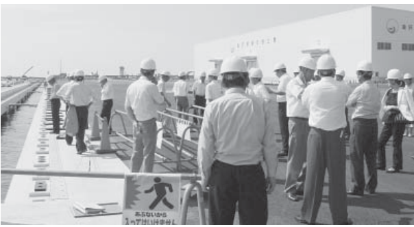
多目的国際ターミナルの整備状況を視察する議員ら。

金沢港湾・空港整備事務 所へ金沢港大野地区の多 目的国際ターミナル整備 事業の取組みについて、 また、国際的な建設機械 メーカーのコマツ金沢工 場を視察しました。