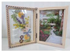
大きさ: 縦 約15.5cm×横 約23.5cm *写真はイメージです