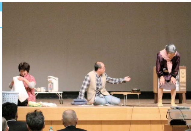
認知症をわかりやすく寸劇で紹介

この講座は、認知症について理解し、認知症の人や家族を温かく見守る応援者である「認知症サポーター」を養成する講座で、町内の介護保険事業所の職員やケアマネージャーなどが「認知症キャラバンメイト」と呼ばれる講師役を務めています。この日は、区長会研修会で約100人の区長が寸劇を交えた養成講座を受講し、認知症やその対応を学び「認知症サポーター」となりました。