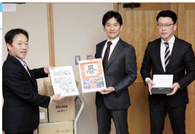
杉本社長(中央)と安中工場長(右)

杉本社長は「今年は、町内の名勝地に加えて、全ての小中学校の校舎を描いたイラストが増えました。子ども達にも親しんでもらえれば嬉しいです」と話しました。