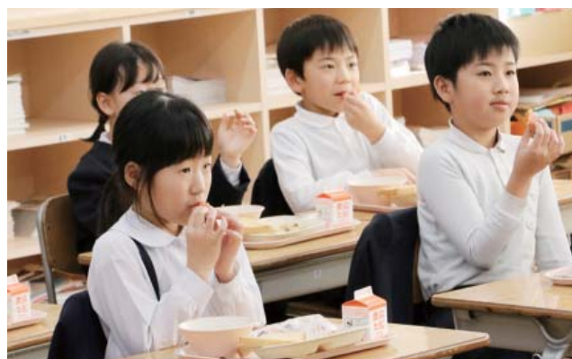
おいしそうにくろ柿を食べる児童