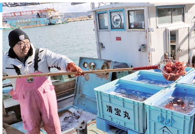
かご漁であがった甘エビ