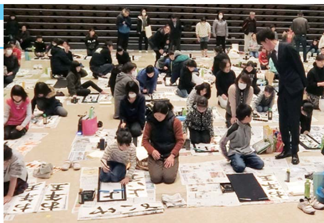
真剣に取り組む児童と温かく見守る家族

会場では、「よい子」「お年玉」「令和の朝」などの文字をのびのびと書き上げていました。