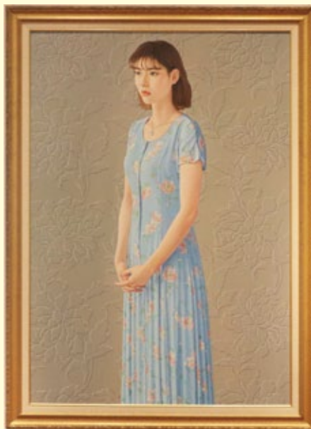
洋画 花風 高崎 高嗣