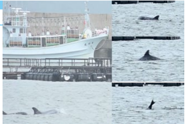
肉眼でもちゃんと確認できます

ハナゴンドウは、国によってクジラの仲間になったり、イルカの仲間になったりしているハクジラ的一种で、英語圏では「Risso's-Dolphin」と表記されます。イカや小魚を主食としており、この時期全国から立ち寄るイカ釣り漁船を追ってやってきたようです。