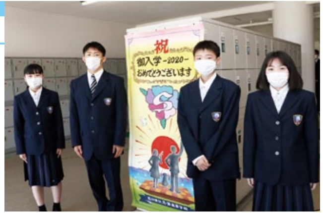
歓迎ポスターの前で抱負を語った新入生