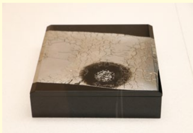
工芸 漆箱「鏡花水月」 福士 健