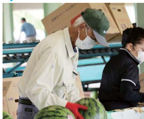
④ 1箱に2個ずつ箱詰めされます