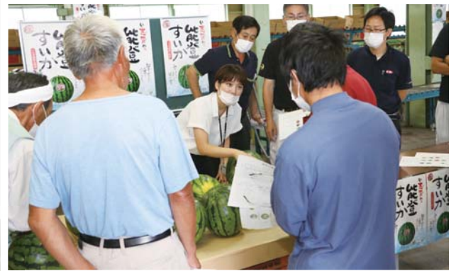
「目合わせ」熱の入ったやりとりが行われました