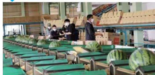
③ 大きさ重さごとに仕分けされます