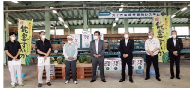
初出荷ということで、新谷組合長（中央）からあいさつ