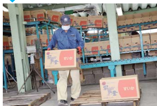
⑤ 種類ごとにまとめられ出荷待ち