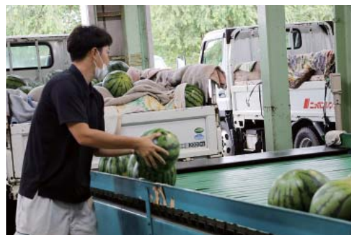
① 農家からトラックで搬入