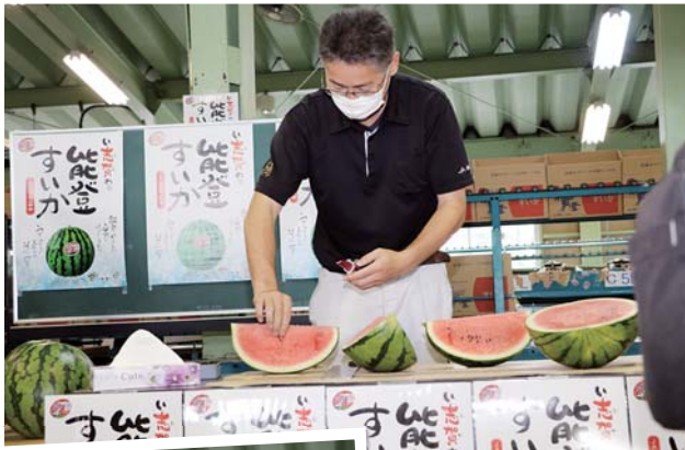
試し割り後の糖度検査