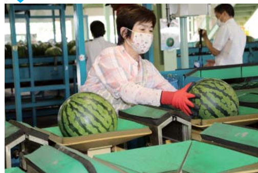
② 一個ずつ丁寧にそろえて