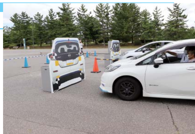
ドライバーシミュレータ体験(左)とサポカー実車体験(右)