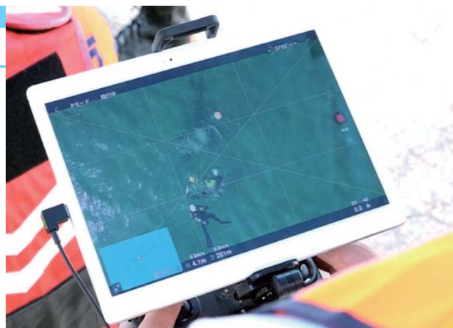
水難現場上空のドローンの映像