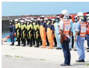
訓練に参加した皆さん

海水浴に来ていた3人が離岸流に流され、うち2人が行方不明になったという想定で、不明者の捜索と現場状況の把握にドローンが有効であることを再確認しました。