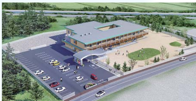
すばる幼稚園完成予想図