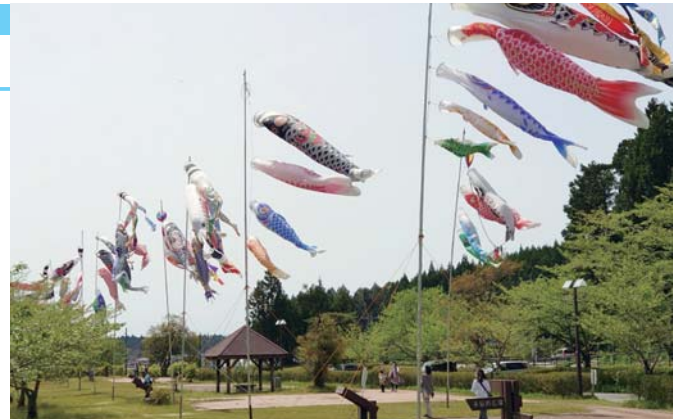
元気に泳ぐこいのぼり(5月4日撮影)

2019年に米町不動の滝で飾られたのが始まりで、昨年は新型コロナウイルスの影響で見送られました。今年は東日本大震災から10年ということで「震災復興やコロナ終息を願い、また町を元気にしたい」という思いで、飾り付けが行われました。国道を走り来するドライバーの目を楽しませ、晴れた日には子ども連れの家族が訪れていました。