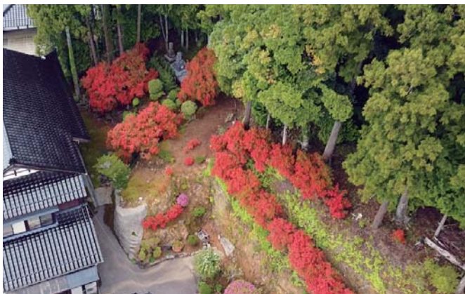
空から見たのとクリシマツツジ(印内地区)