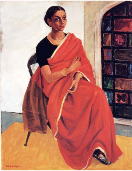
あか 緋いサリー (144cm × 111cm)