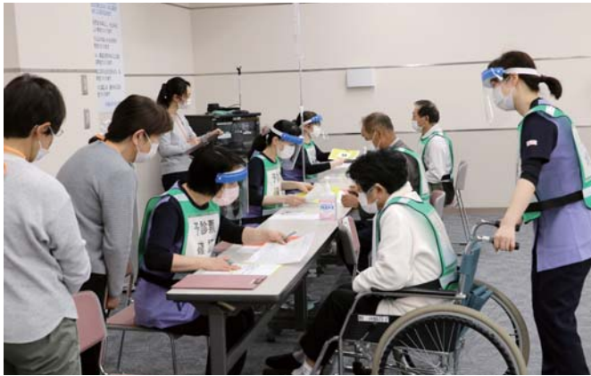
スムーズに進むように受付作業を確認