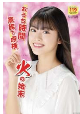
令和4年春季火災予防運動ポスター